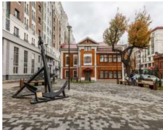
Фото 2. Сквер имени В.И. Альбанова