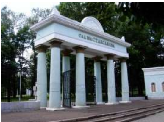
Фото 1. Сад имени С.Т. Аксакова