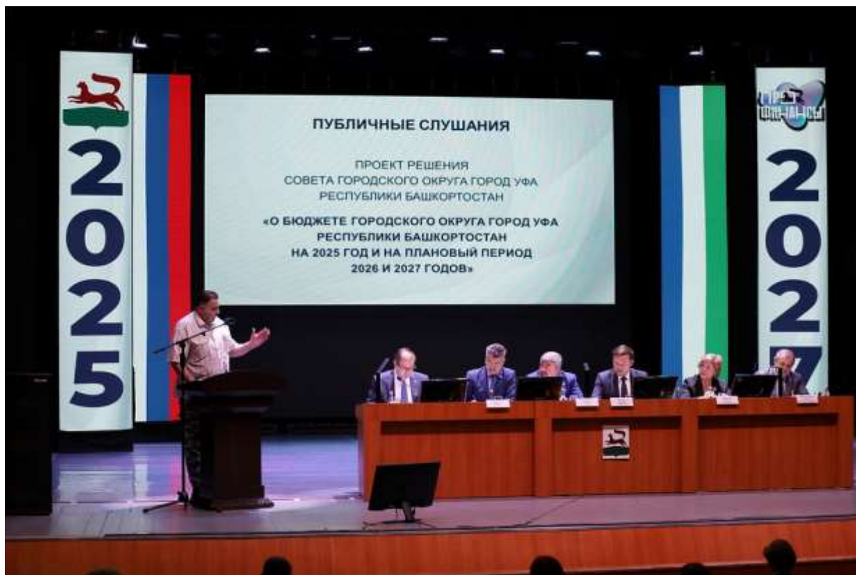
Фото 7. Публичные слушания по проекту бюджета на 2025 год и на плановый период 2026 и 2027 годов

На публичных слушаниях были рассмотрены проект отчета об исполнении бюджета за 2023 год и проект бюджета городского округа город Уфа Республики Башкортостан на 2025 и на плановый период 2026 и 2027 годов.