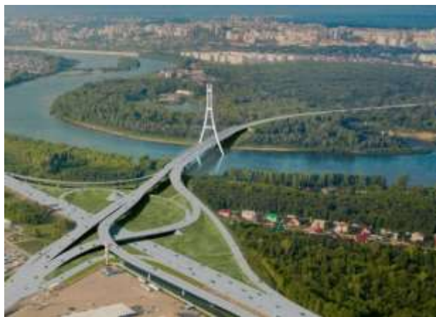
Фото 3. Проект строительства Южного обхода Уфы