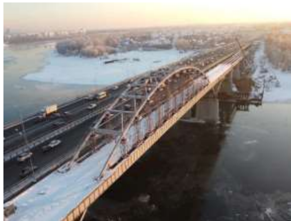
Фото 4. Мост через реку Белую в створе ул. Воровского