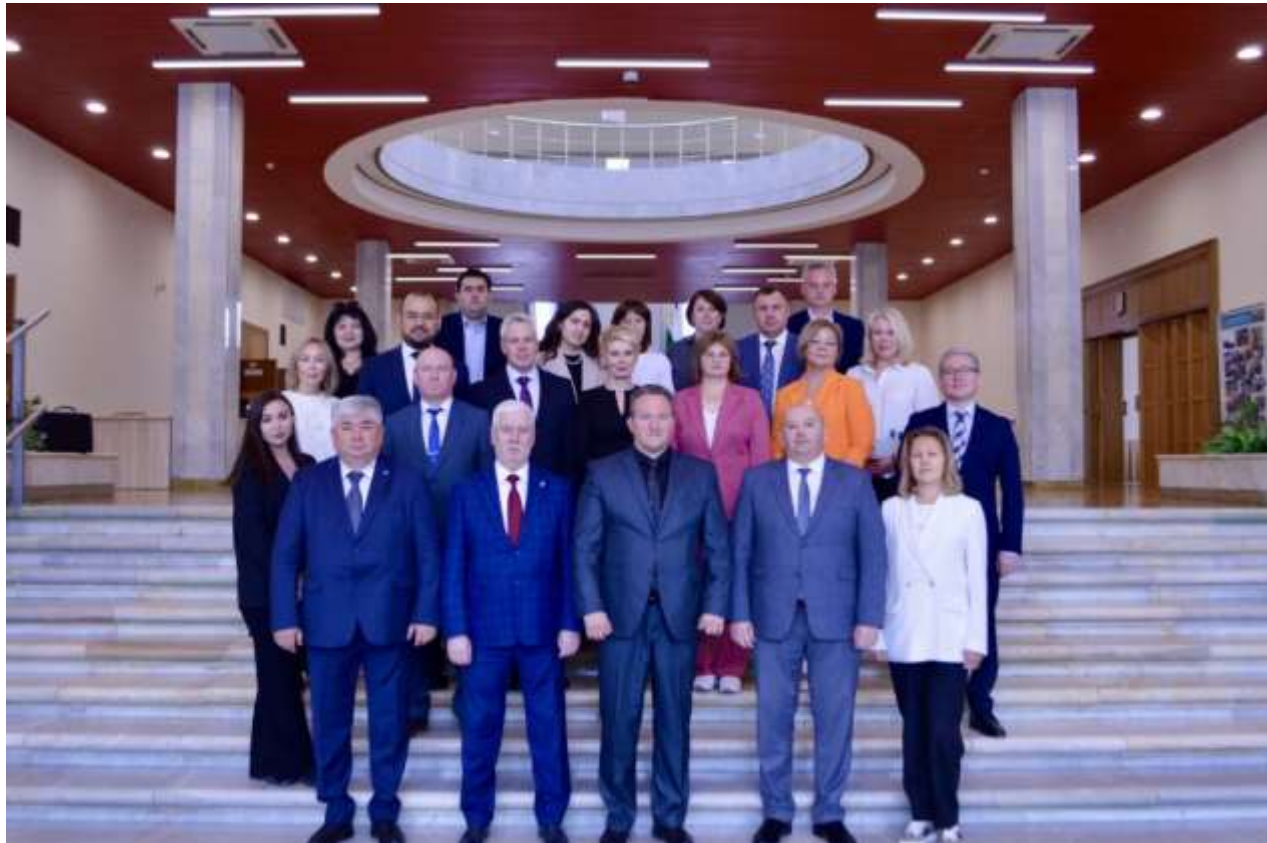
Фото 8. Расширенное заседание Президиума Совета контрольно-счетных органов Республики Башкортостан

Сотрудники КСП Уфы активно привлекались к участию в мероприятиях, организованных КСП РБ.