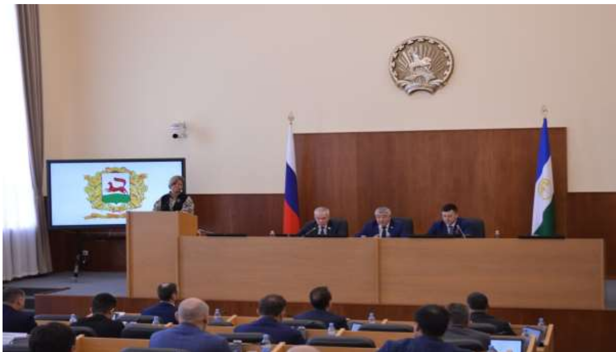
Фото 6. 38-ое заседание Совета городского округа город Уфа Республики Башкортостан