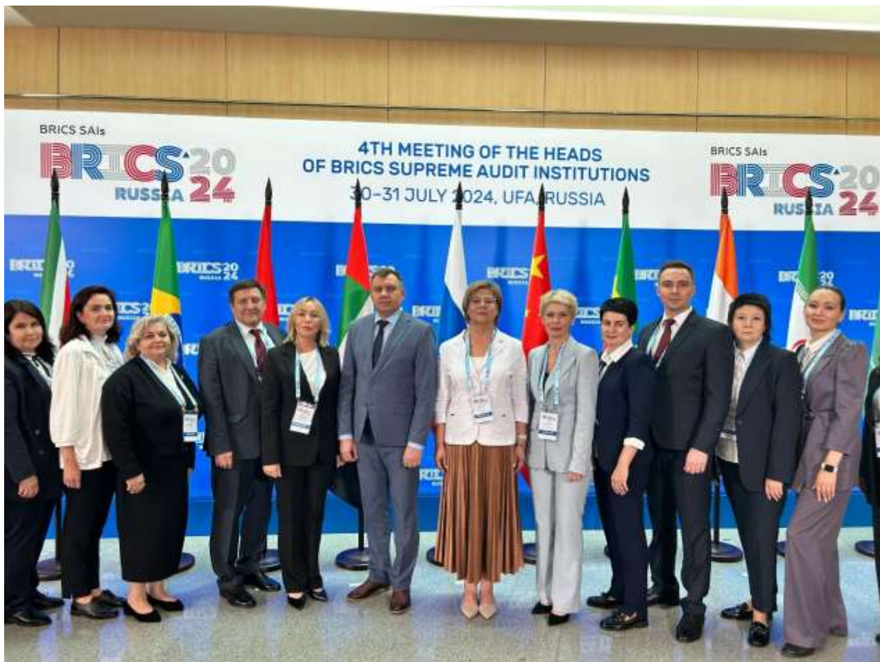
Фото 9. Представители Контрольно-счётной палаты Уфы на VI встрече делегации высших органов аудита БРИКС и контрольно-счетных органов субъектов Российской Федерации

30-31 июля в городе Уфа представители КСП Уфы участвовали в VI встрече делегаций высших органов аудита БРИКС и контрольно-счетных органов субъектов Российской Федерации, в которой принял участие Председатель Счетной палаты Российской Федерации Борис Ковальчук. На мероприятии принята Уфимская декларация и утвержден План работы высших органов аудита на 2025-2026 годы.