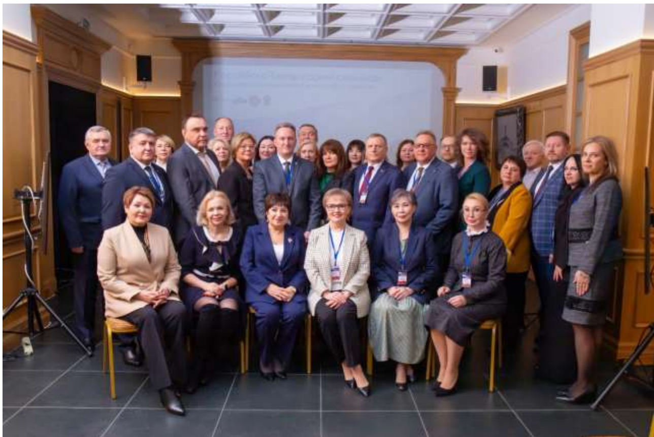
Фото 15. Российско-Белорусский семинар на тему «Отдельные вопросы внешнего финансового контроля» в городе Суздаль

подхода, а также контрольные и аналитические процедуры при проведении финансового аудита», «Методология и практика аудита в сфере закупок товаров, работ и услуг», «Совершенствование качества мероприятий внешнего муниципального финансового контроля», «О некоторых вопросах применения норм административного законодательства при осуществлении полномочий внешнего муниципального финансового контроля», «Типовые нарушения, выявляемые в ходе внешней проверки бюджетной отчетности главных администраторов бюджетных средств».