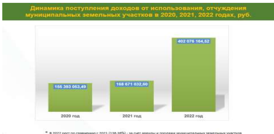
Фото 5. Динамика поступления доходов от использования, отчуждения муниципальных земельных участков в 2021 – 2022 годах

Поступления доходов местного бюджета от использования, отчуждения муниципальных земельных участков в 2020, 2021, 2022 годах имели тенденцию роста.