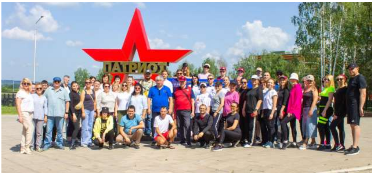
Фото 11. Участники забега с препятствиями «Гонка героев» на базе военно-патриотического парка Республики Башкортостан «Патриот» имени Героя Российской Федерации Серафимова Максима Владимировича

соглашений, методологии и методов аудита, цифровой трансформации, вопросы экологии, борьбы с коррупцией и другие актуальные вопросы, находящиеся в сфере внимания органов аудита.